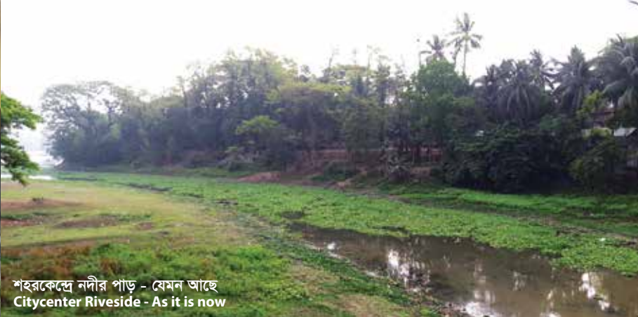
শহরকেন্দ্রে নদীর পাড় - যেমন আছে Citycenter Riverside - As it is now