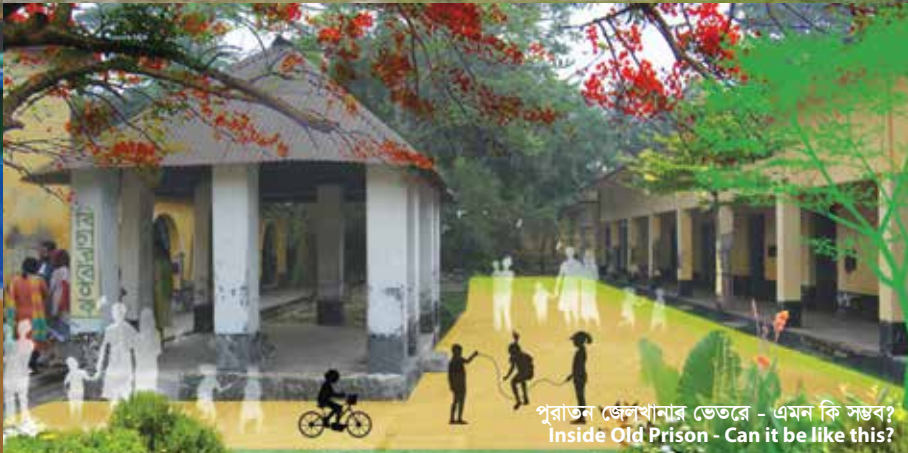
পুরাতন জেলখানার ভেতরে - এমন কি সম্ভব? Inside Old Prison - Can it be like this?