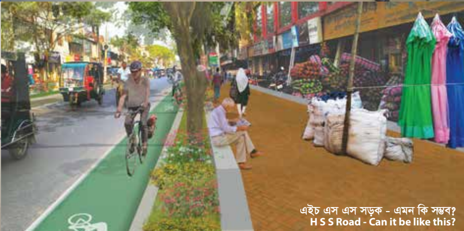
এইচ এস এস সড়ক - এমন কি সম্ভব? H S S Road - Can it be like this?