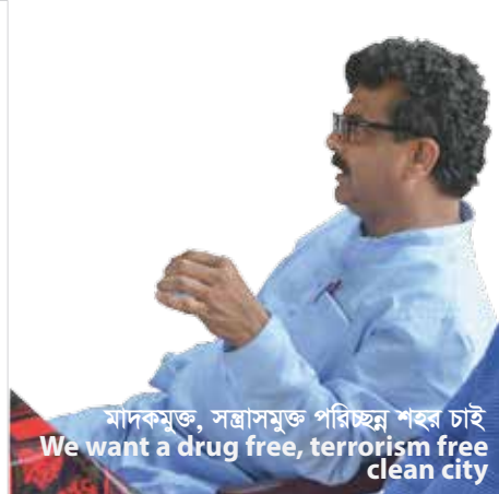
মাদকমুক্ত, সন্ত্রাসমুক্ত পরিচ্ছন্ন শহর চাই We want a drug free, terrorism free clean city

Citizens of Jhenaidah City | Jhenaidah Municipality | Co.Creation.Architects | ALIVE