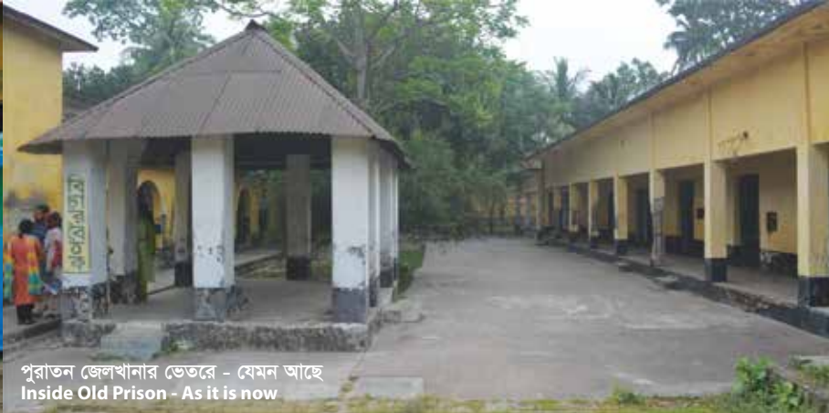
পুরাতন জেলখানার ভেতরে - যেমন আছে Inside Old Prison - As it is now