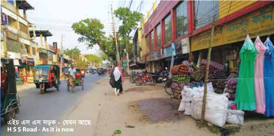
এইচ এস এস সড়ক - যেমন আছে H S S Road - As it is now