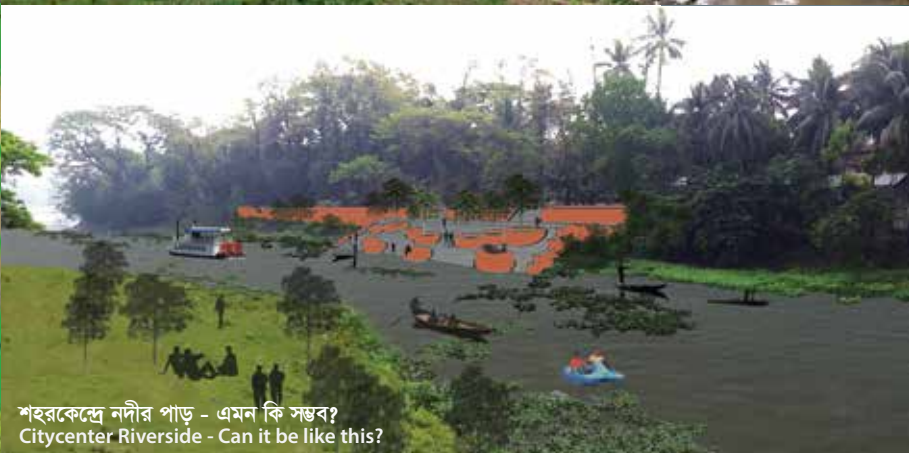
শহরকেন্দ্রে নদীর পাড় - এমন কি সম্ভব? Citycenter Riverside - Can it be like this?