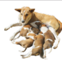
সবাই মিলে সঞ্চয় করে একত্রিত হই